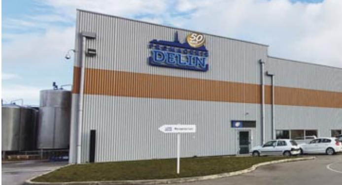
Fromagerie Delin à Gilly-lès-Cîteaux