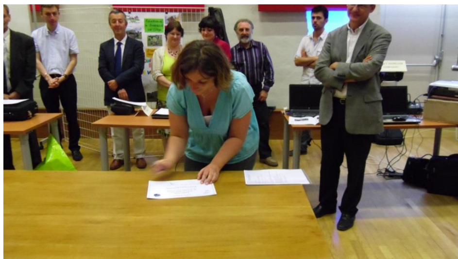
Signature du diplôme de labellisation