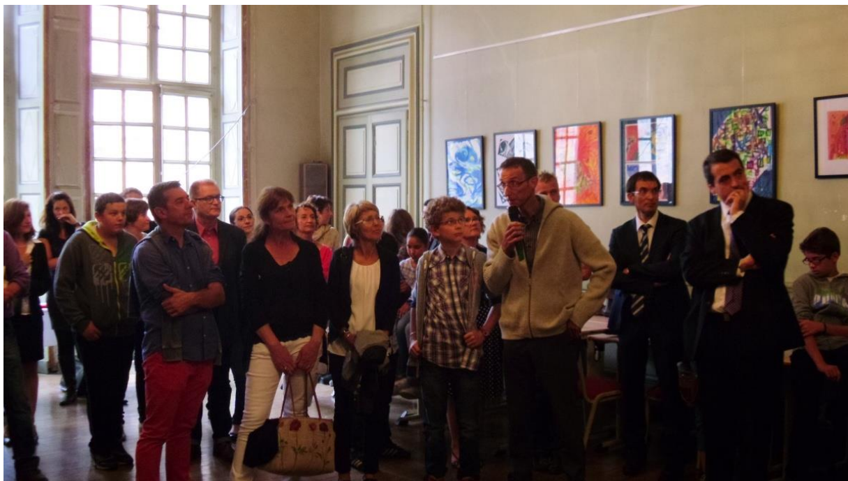
L'équipe du Collège de la Source

Le label E3D (Etablissement en Démarche de Développement Durable) du collège de la Source de Mouthe a été renouvelé en juin 2015.