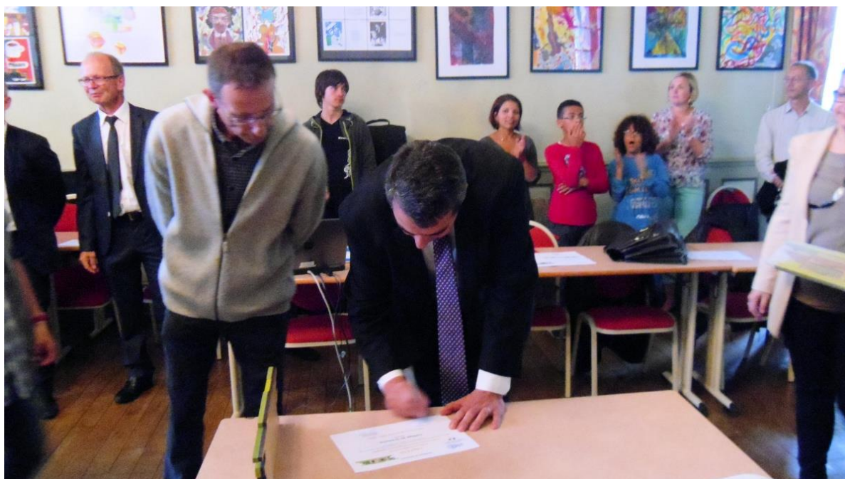
Signature du diplôme de labellisation

Des aliments qui parcourent des milliers de kilomètres en camions ou en avions représentent un gaspillage d'énergie : chaque kilomètre parcouru (en camion) demande x litres de pétrole qui pourraient être économisés si nous produisions nos aliments localement.